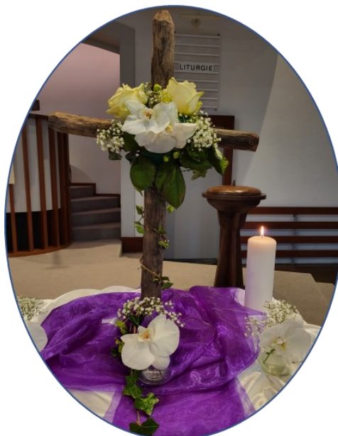
Foto: Liturgische bloemschikking Eeuwigheidszondag